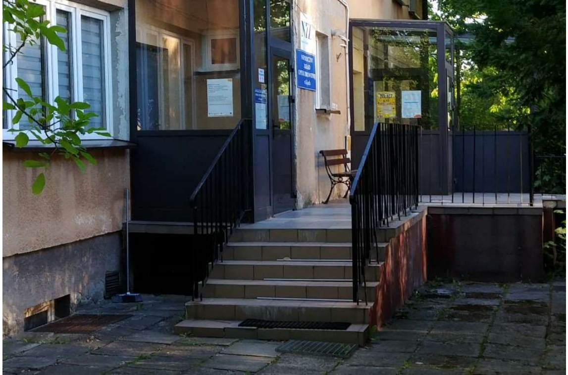
Schody wejścia głównego.

Schody do podpiwniczenia oraz schody do gabinetu należy obłożyć płytkami mrozoodpornymi o ścieralności minimum 5.